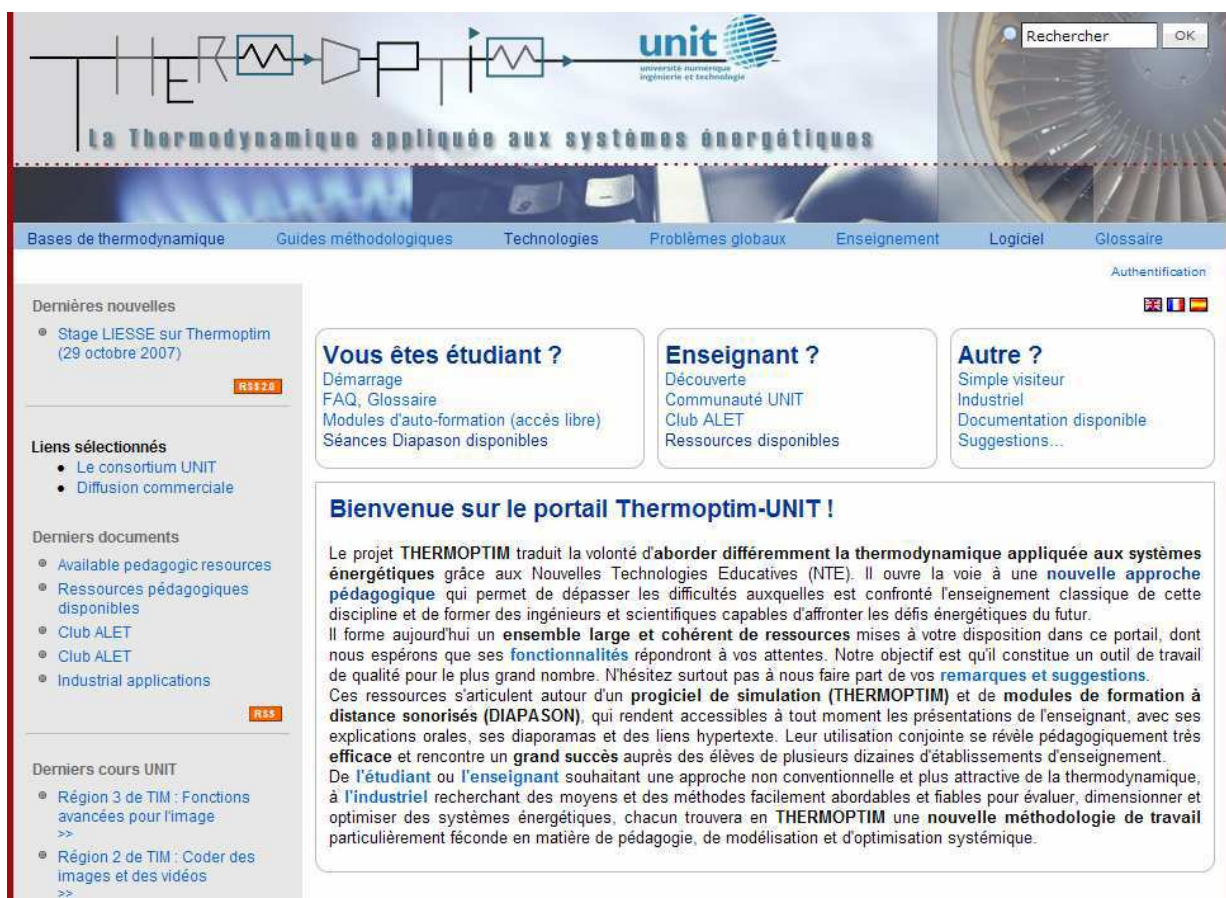
FIG. 1 – écran d'accueil du portail

En complément, le texte de bienvenue présente en quelques lignes le rôle du portail et propose au visiteur de commencer par prendre connaissance de ses principales fonctionnalités.