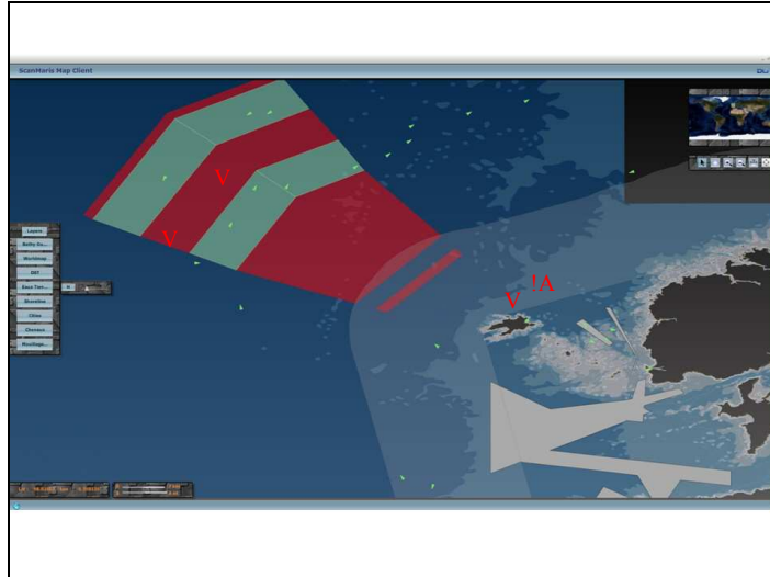
Figure 4 : Situation maritime renseignée et analysée, 17 octobre 2008