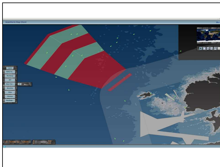
Figure 3 : Situation maritime du chenal de la Helle et du DST Ouessant, transcrite sur fond cartographique ENC, format S57.

La situation du 17 octobre 2008 à 12H est figurée ci dessous :