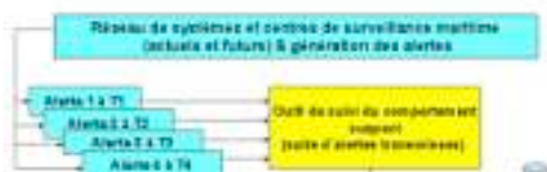
Figure 2 : Architecture du démonstrateur TAMARIS

Le schéma ci-après donne l'architecture des ces composantes de traitement, de fusion et d'analyse de l'information, et précise comment seront exploités ces outils pour générer des dossiers d'enquêtes électroniques durant le déroulement d'un comportement suspect.