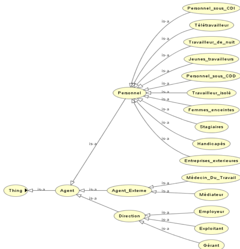
Fig 1 : Présentation d'un extrait de l'ontologie réalisée : Agent

L'ontologie créée relève du domaine de la réglementation française en santé et sécurité au travail. Elle traite plus particulièrement des obligations des « agents », à savoir les employeurs, les chefs d'établissements et plus largement les délégués de pouvoir. Des recherches complémentaires ont permis de repérer une ontologie de niveau « supérieur », c'est-à-dire classant des concepts de haut niveau, utile à la définition de la base de connaissances. L'ontologie LKIF (Legal Knowledge Interchange Format) a donc été retenue. LKIF se compose de 155 classes, 97 propriétés de classes, 266 annotations et sa portée se concentre sur les concepts primitifs du droit. Elle ne propose aucun individu, aucune instance (ontologie dite de « top-level »). Un travail a donc été conduit afin de constituer un corpus traduisant la réglementation française. Les termes candidats ont été extraits à l'aide de la méthode Yatea [8] ainsi que par la conduite de nombreuses interviews d'experts du domaine. La construction de l'ontologie SST s'est réalisée sur une profondeur allant de trois à dix niveaux, ce qui a conduit à la définition de 200 termes organisés en deux grandes catégories : « Agent » et « Action ». Les figures 1 et 2 illustrent deux extractions de l'ontologie centrées sur les concepts « Agent » et « Action ». Ces deux branches de l'ontologie étant utilisées principalement pour la définition des exigences réglementaires.