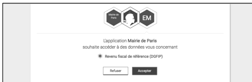
Figure 3. Autorisation d'échanger une donnée, SGMAP, 2017