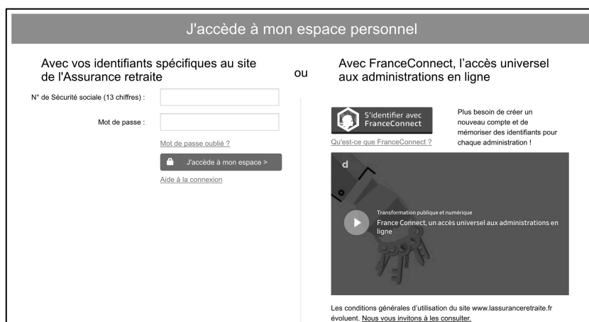
Figure 2. Interface de connexion à de l'Assurance retraite